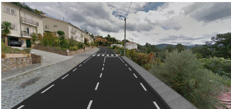
LUGAR DA SERRA