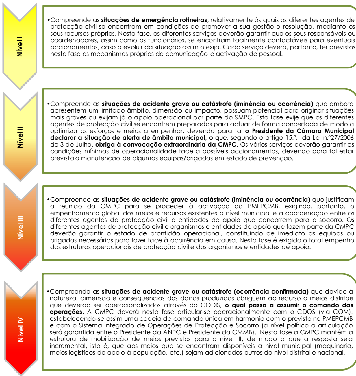
Figura 2. Níveis de intervenção na fase de emergência