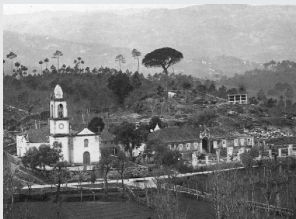
fotografia antiga (sem data)