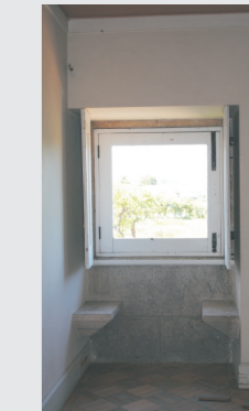
vista do interior de um dos quartos