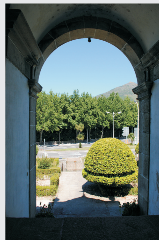
vista do hall de acesso à capela para os jardins