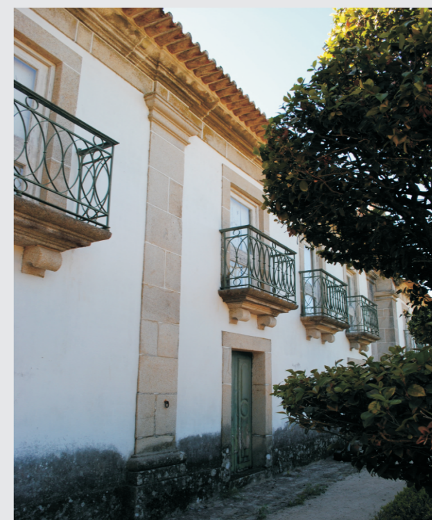
vista do alçado principal - Jardim