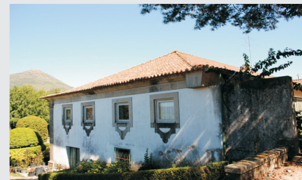
vista do alçado lateral direito