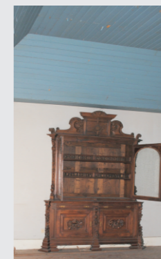
vista do interior de uma das salas