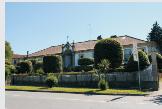
vista do alçado principal