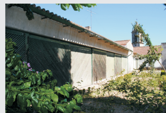
vista do alçado posterior